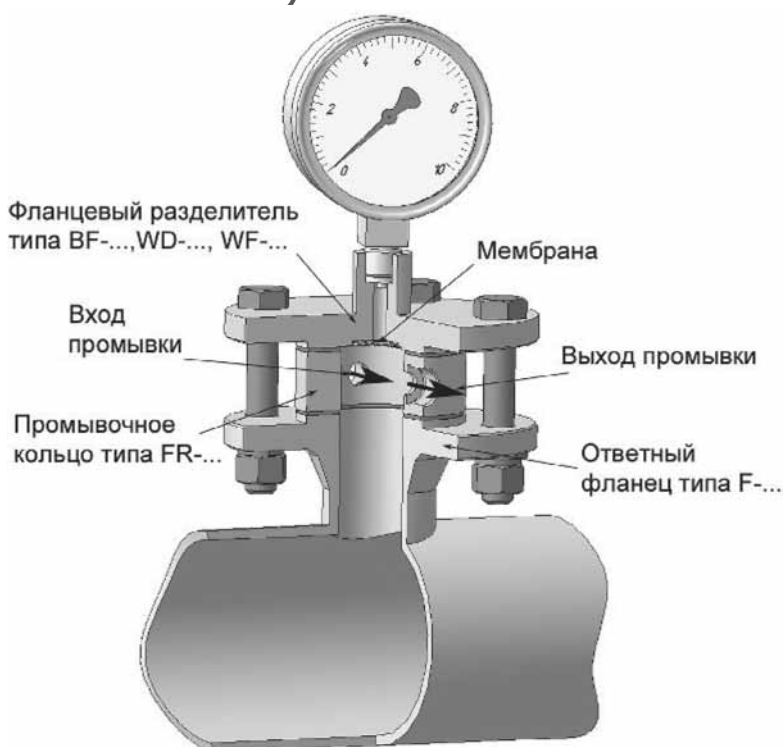
Схема установки (монтажная схема)